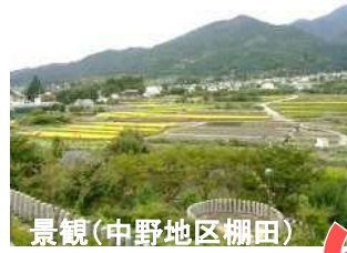
景観(中野地区棚田)