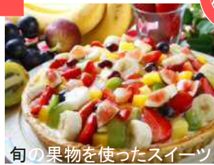
旬の果物を使ったスイーツ