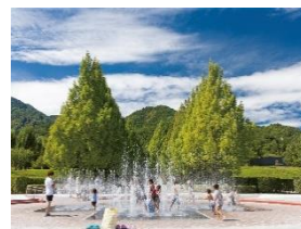
富士川クラフトパーク