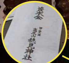
商売繁昌♪ 家内繁昌♪

商売繁昌・家内繁昌の元手となる資本金を神社から借り、翌年には倍にして返すという風習。現在では倍返しのところから始めていると考えればわかりやすく、金額を選び、例えば申込書に二千元を添えて申し込むと、この袋の中に祈願された千円札の新札と「金百万円資本金章」という章を頂けます。