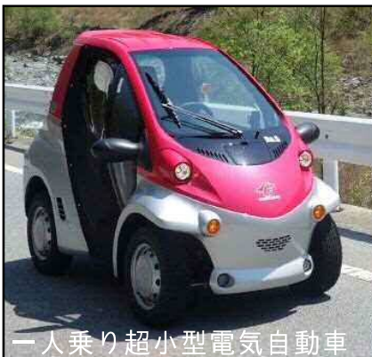
一人乗り超小型電気自動車