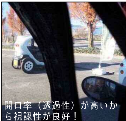
開口率（透過性）が高いから視認性が良好！