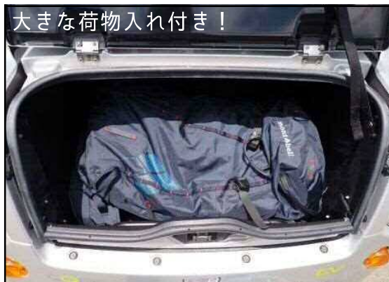
大きな荷物入れ付き！