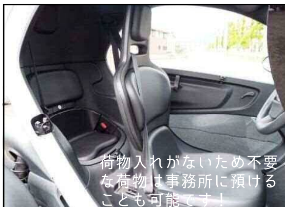
荷物入れがないため不要な荷物は事務所に預けることも可能です！