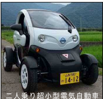
二人乗り超小型電気自動車