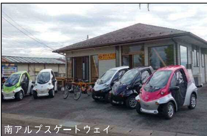
南アルプスゲートウェイ