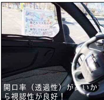
開口率（透過性）が高いから視認性が良好！