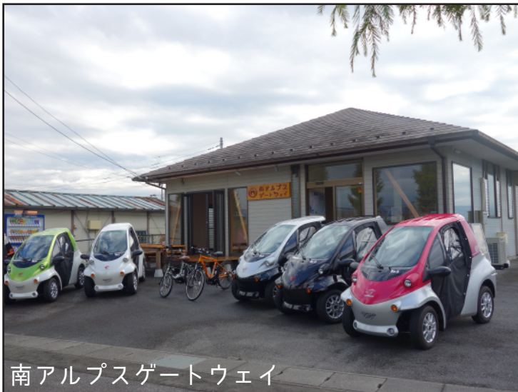
南アルプスゲートウェイ