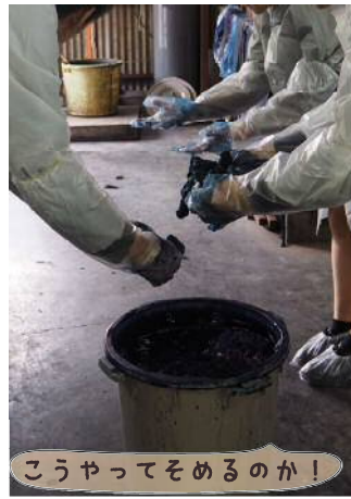
こうやってそめるのか!

注意事項 エプロン、手袋、シューズカバーをお貸し致しますが、染料が衣服や靴に付着した場合落ちなくなりますので、汚れても良い格好でご参加下さい。