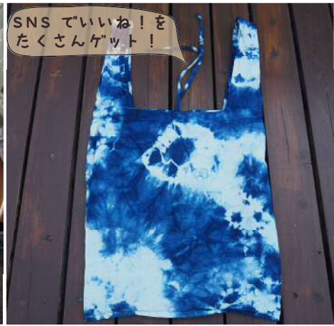
SNSでいいね!をたくさんゲット!