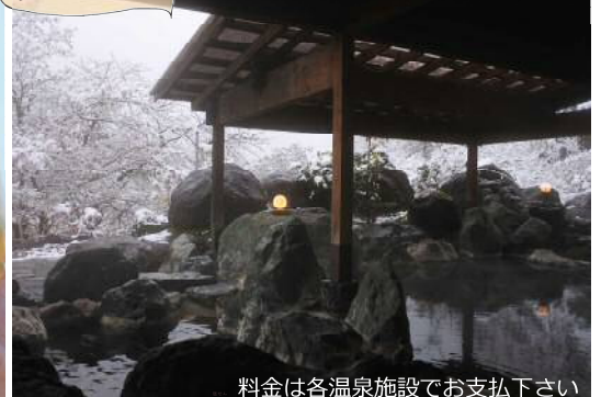
料金は各温泉施設でお支払下さい