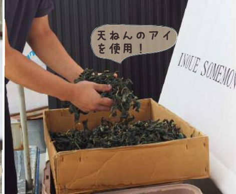
天ねんのアイを使用!