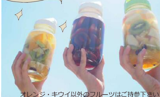
オレンジ・キウイ以外のフルーツはご持参下さい