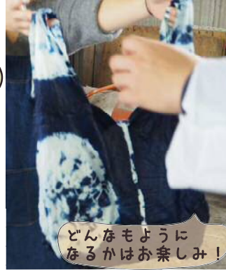
どんなもようになるかはお楽しみ!